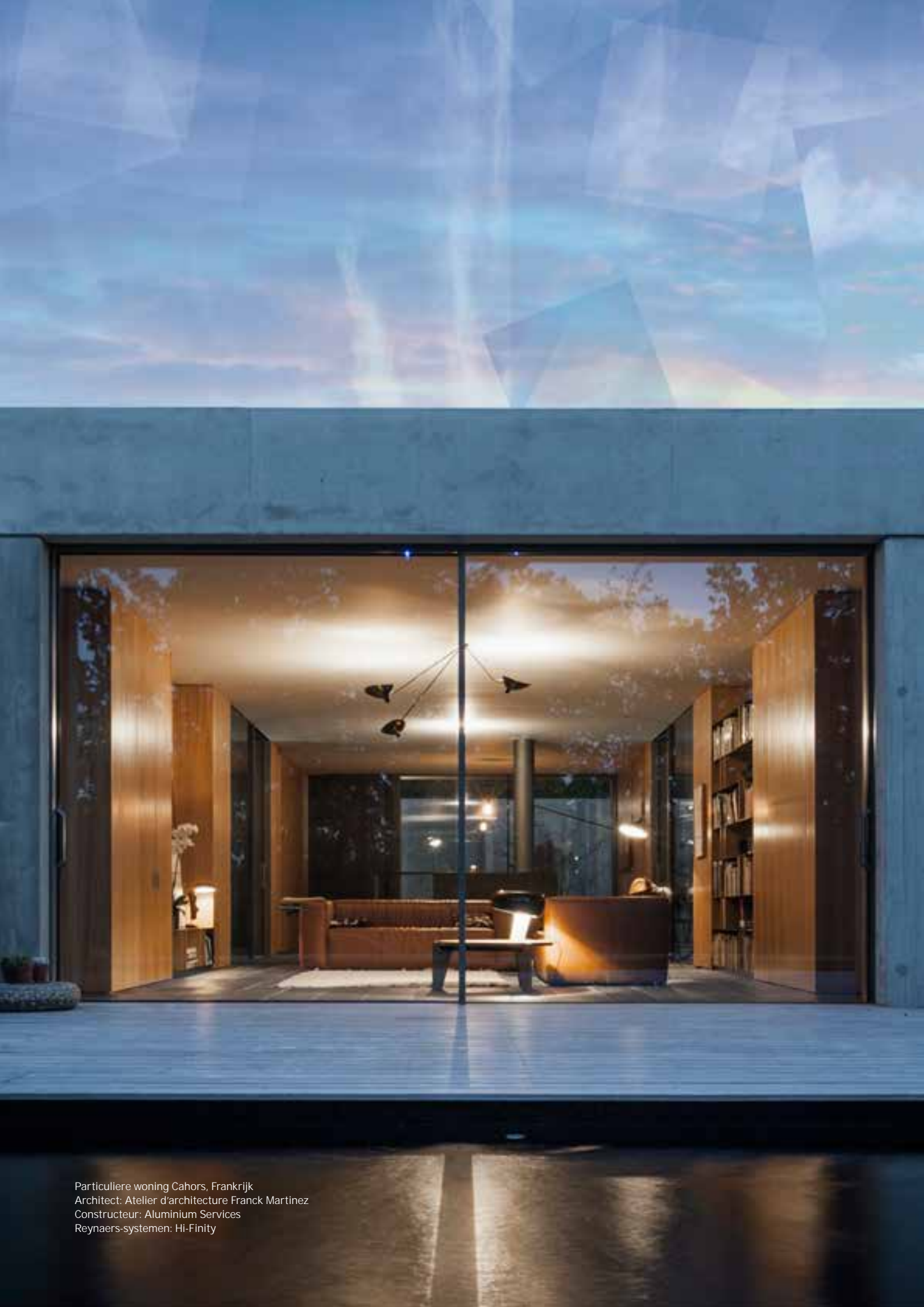
Particuliere woning Cahors, Frankrijk Architect: Atelier d'architecture Franck Martinez Constructeur: Aluminium Services Reynaers-systemen: Hi-Finity